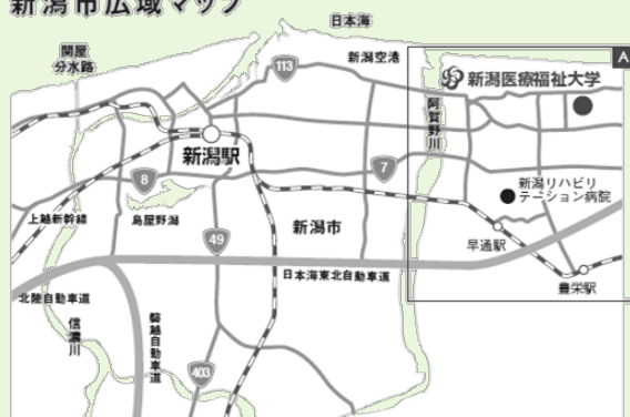
新潟市広域マップ